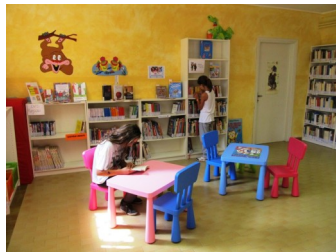
La sezione ragazzi