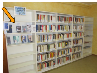
La sezione narrativa per adulti e lo scaffale delle novità